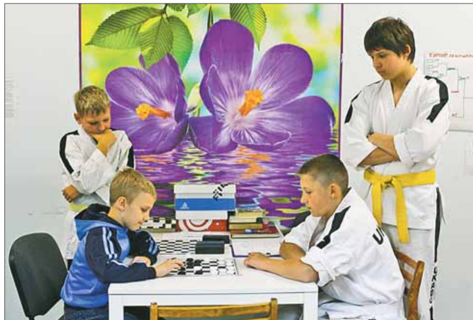
Каратисты за шахками